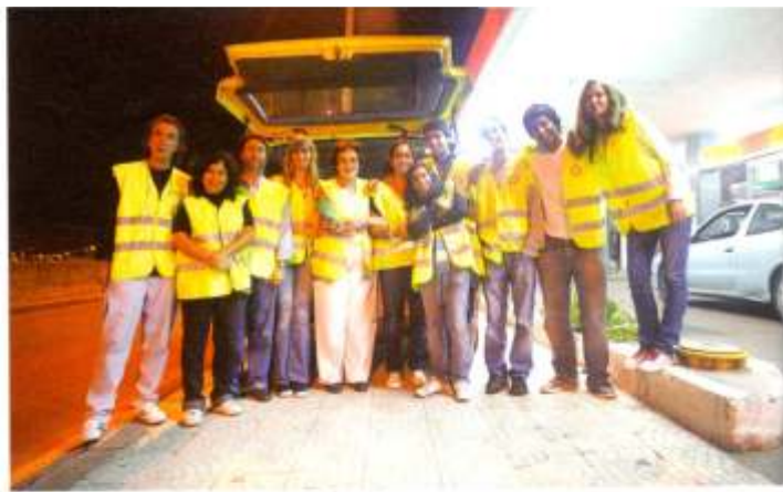
*Grupo do Colégio Nossa Senhora do Rosário